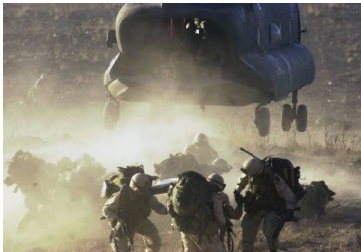
Amerikanske soldater gjør seg klar til å rykke ut etter å ha blitt transportert til kampsonen under Operasjon Anaconda. Norske spesialjegerne fra Forsvarets spesialkommando (FSK) deltok også i operasjonen.

denne måten å drive forretninger på samsvarte ikke med den amerikanske måten å se tingene på: