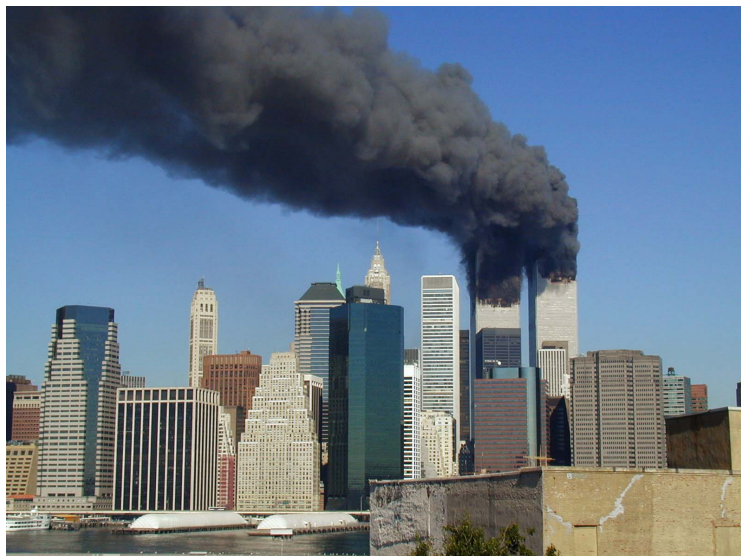
Den 11. september 2001 kapret terrorister tilknyttet al-Qaida fire fly og angrep symboltunge bygninger i USA. Blant disse var tvillingtårnene i World Trade Center på Manhattan i New York.

dramatically, I came to the conclusion that we were at war.» 6 Denne vurderingen var Bush også tidlig ute med å meddele det amerikanske folk, og sa dagen etter angrepet: «The deliberate and deadly attacks which were carried out yesterday against our country were more than acts of terror. They were acts of war.» 7