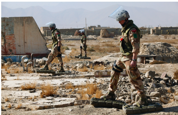
Norges første operative avdeling i Afghanistan var et EOD-lag med 16 mineryddere og to mineryddingsmaskiner.

NATOs oppgave måtte derfor bli å sikre freden, i den grad den fantes, og det var her Norge fikk sin mest substansielle rolle. Selv om de norske myndighetene kom til den erkjennelsen høsten 2001 at de ønsket å bidra militært i Afghanistan, var det ikke så enkelt å finne noe å sende. Det mest gripbare var små, men høykompetente miljøer knyttet til spesialstyrker, mineryddere og fly.