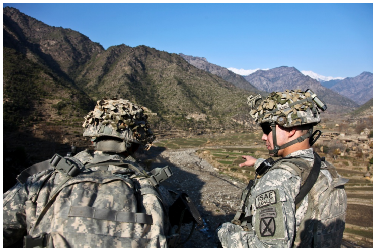
Amerikanske soldater fra 10th Mountain Division, eller 10. bergdivisjon. Avdelingen er satt opp for rask deployering hvor som helst i verden, og var blant de første som ankom Afghanistan under Operation Enduring Freedom.

Force (KFOR), general sir Mike Jackson, berømt da han hørte når Hærens hurtige reaksjonsstyrke, Telemark bataljon, skulle innfinne seg i teateret: «What's taking so long? Are they walking?» 52