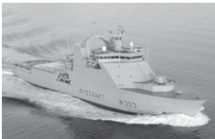
KV Svalbard.

Norge er en maritim nasjon med klare rettigheter og forpliktelser innen sine jurisdiksjonsområder til havs. Norge må derfor evne å ivareta dette på en god måte til enhver tid, og trenger en profesjonell, kompetent og alltid tilstedeværende Kystvakt som er en naturlig del av det daglige maritime bildet. Kystvakten er Statens viktigste myndighetsutøver utenfor territorialfarvannet i fredstid, og skal vise det norske flagget og demonstrere både norsk vilje og evne. Kystvaktens betydning er etter min mening derfor klart økende, og utfordringene i nordområdet er mange og komplekse.