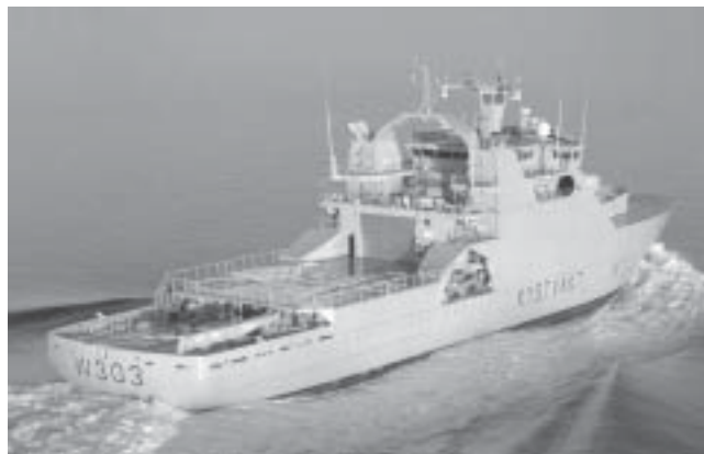
KV Svalbard vil øke sikkerheten og gi bedre muligheter til å kontrollere virksomheten i Barentshavet.

Fiskevernsonen rundt Svalbard er norsk jurisdiksjonsområde, og det er norsk fiskerilovgivning og kyststatsjurisdiksjon som gjelder i området. Imidlertid har de fleste nasjoner, inkludert Russland, ikke anerkjent det norske rettsfundament for opprettelsen av sonen. Det er Kystvakten som ivaretar norsk myndighetsutøvelse i det daglige i området, og norsk fiskerilovgivning og Kystvaktens